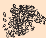
Brytyjskie brązowe siemię lniane